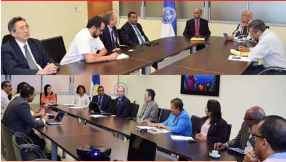
Vista de dos encuentros en los que el visitante comparte con autoridades y docentes de la FCS.