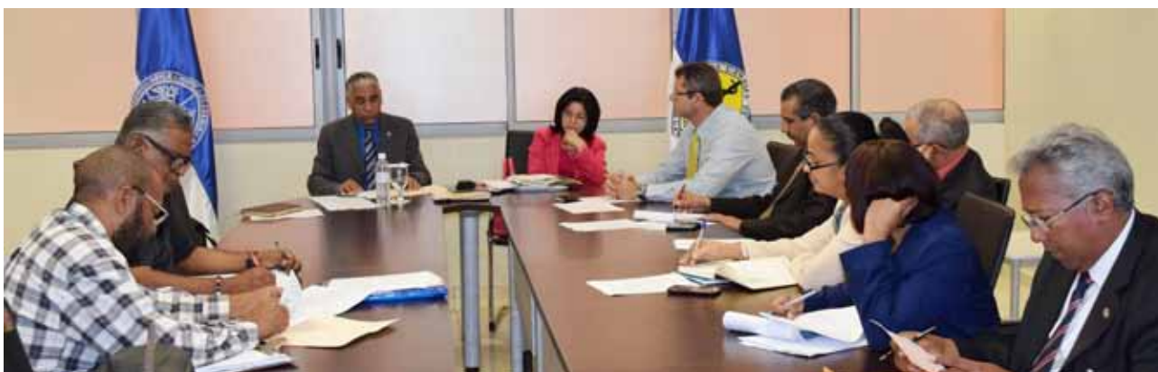
Autoridades y técnicos de la FCS trabajan en la elaboración del plan de descongestionamiento de carreras.

Las autoridades de la Facultad de Ciencias de la Salud (FCS) trabajan en un plan, que tiene como objetivo implementar estrategias para egresar en el menor tiempo posible a todos los estudiantes que hayan excedido el período estipulado en su plan de estudio, garantizando así el normal desenvolvimiento del proceso académico para aquellos que han avanzado acorde con lo establecido en sus respectivos planes.