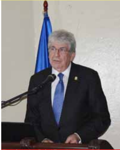
El conferencista Rafael Espada durante su disertación

La Universidad Autónoma de Santo Domingo (UASD), a través de su Facultad de Ciencias de la Salud (FCS), organizó la conferencia magistral titulada “Consentir el Daño: Investigación de EE.UU en Guatemala 1946-1948”, dictada por el exvicepresidente de esa nación centroamericana, doctor Rafael Espada.