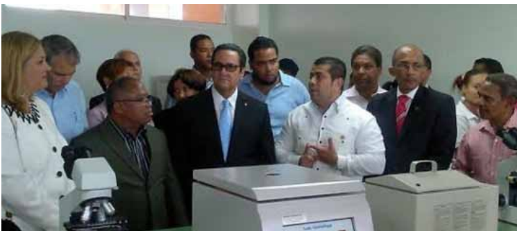
Embajadores del ALBA hacen entrega de los equipos donados a las autoridades universitarias.