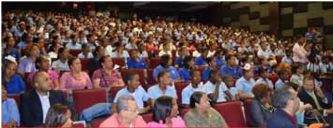
Esta panorámica muestra el gran respaldo que tuvo la actividad.