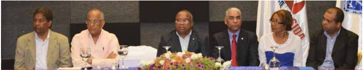
Autoridades universitarias y del sector salud que presidieron la mesa de honor.

El Centro Universitario UASD-Barahona fue el lugar escogido para la realización de la Tercera Feria de Educación sobre Salud Sexual y Salud Reproductiva, organizada por la Facultad de Ciencias de la Salud, de la Universidad Autónoma de Santo Domingo (UASD), el Ministerio de Salud Pública (MSP), y el Consejo Nacional para el VIH y el SIDA (CONAVIHSIDA), actividad que contó