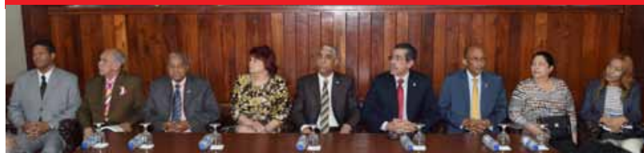
Autoridades universitarias que presidieron la actividad junto a representantes del Consejo Nacional de Residencias Médicas.

Un total de 4 mil 427 médicos fueron evaluados en el Examen Nacional Único para Aspirantes a Residencias Médicas que organiza la Oficina de Residencias Médicas de la Facultad de Ciencias de la Salud, de la Universidad Autónoma de Santo Domingo (UASD), bajo la dirección del Consejo Nacional de Residencias Médicas, con lo cual estos profesionales pretenden acumular la puntuación