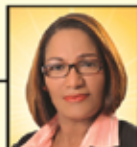
Licda. Familia Dir. Esc. Enfermería